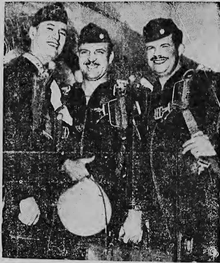
DE AMERIKAANSE LUCHTMACHT maakte bekend dat een bemanning, geheel bestaande uit piloten uit Texas de eerste non-stop straal-bommenwerpervlucht maakte over de Stille Oceaan. De bemanning verdiende hiermede een bijzondere onderscheiding. De afstand welke werd afgelegd bedroeg 3460 mijlen van Alaska naar Japan en duurde negen uur en 50 minuten.

Men hoopt, dat de belangstelling groot genoeg zal blijken om deze onkosten cruit te halen.